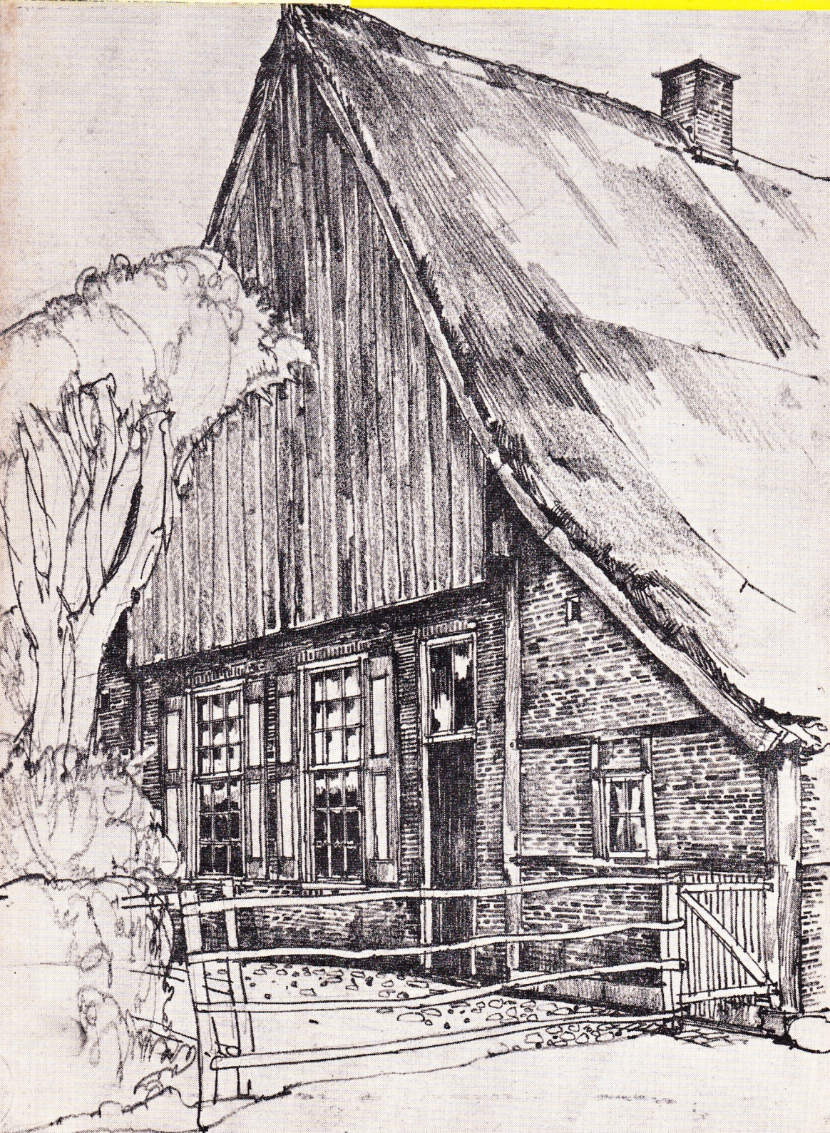
Boerderij bij Werden